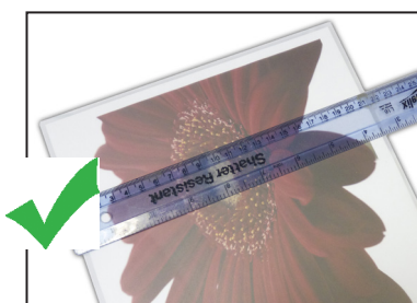
Centre el documento