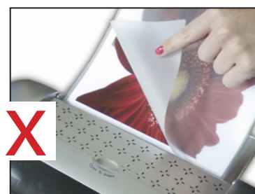
No plastifique el extremo abierto primero